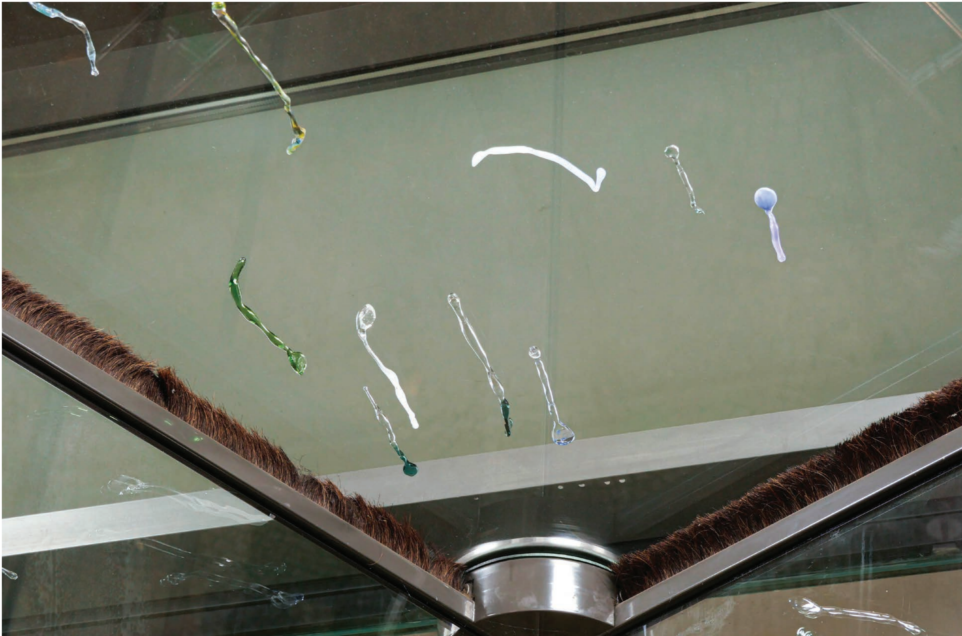
Fond de tiroir