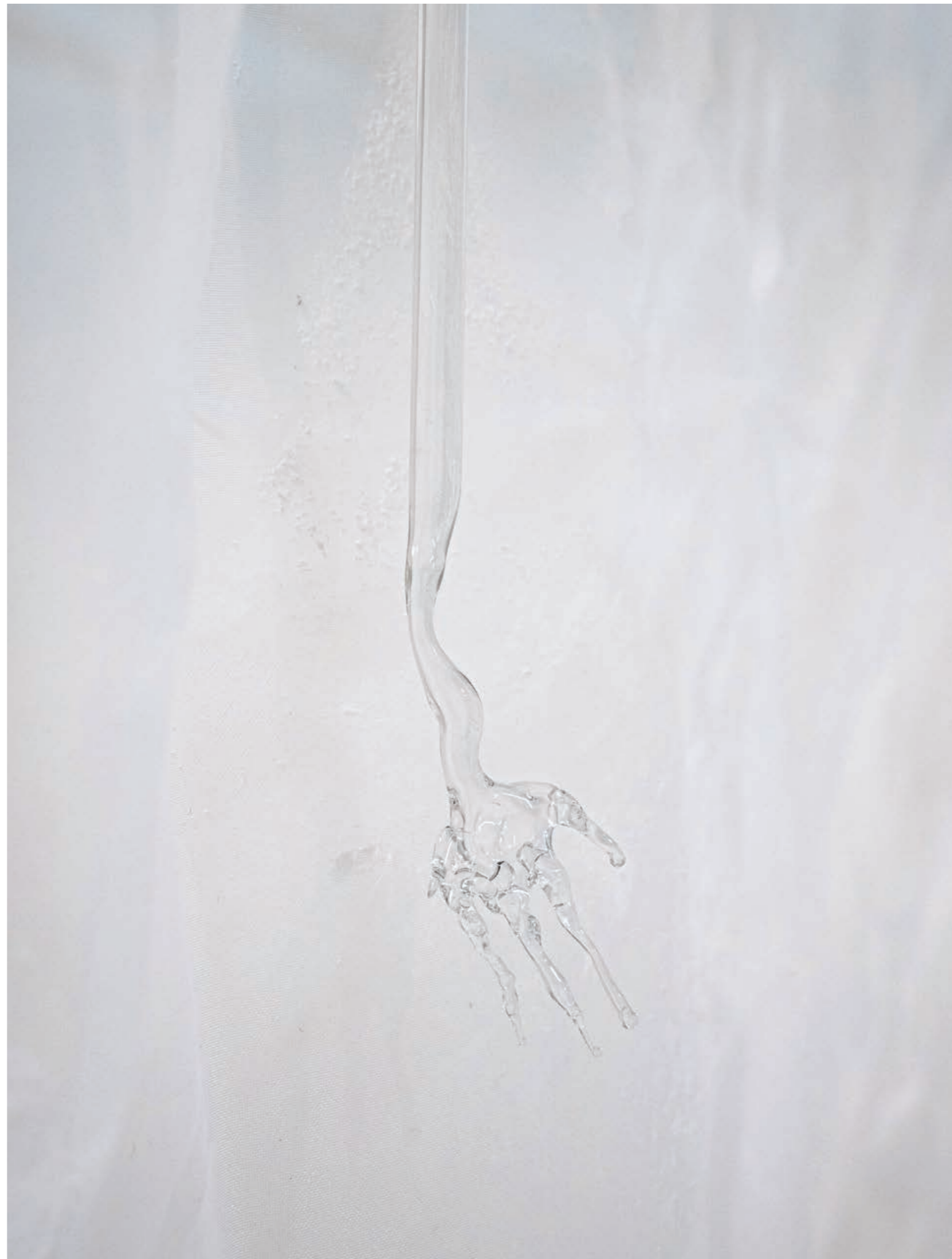
Jus de coquilles