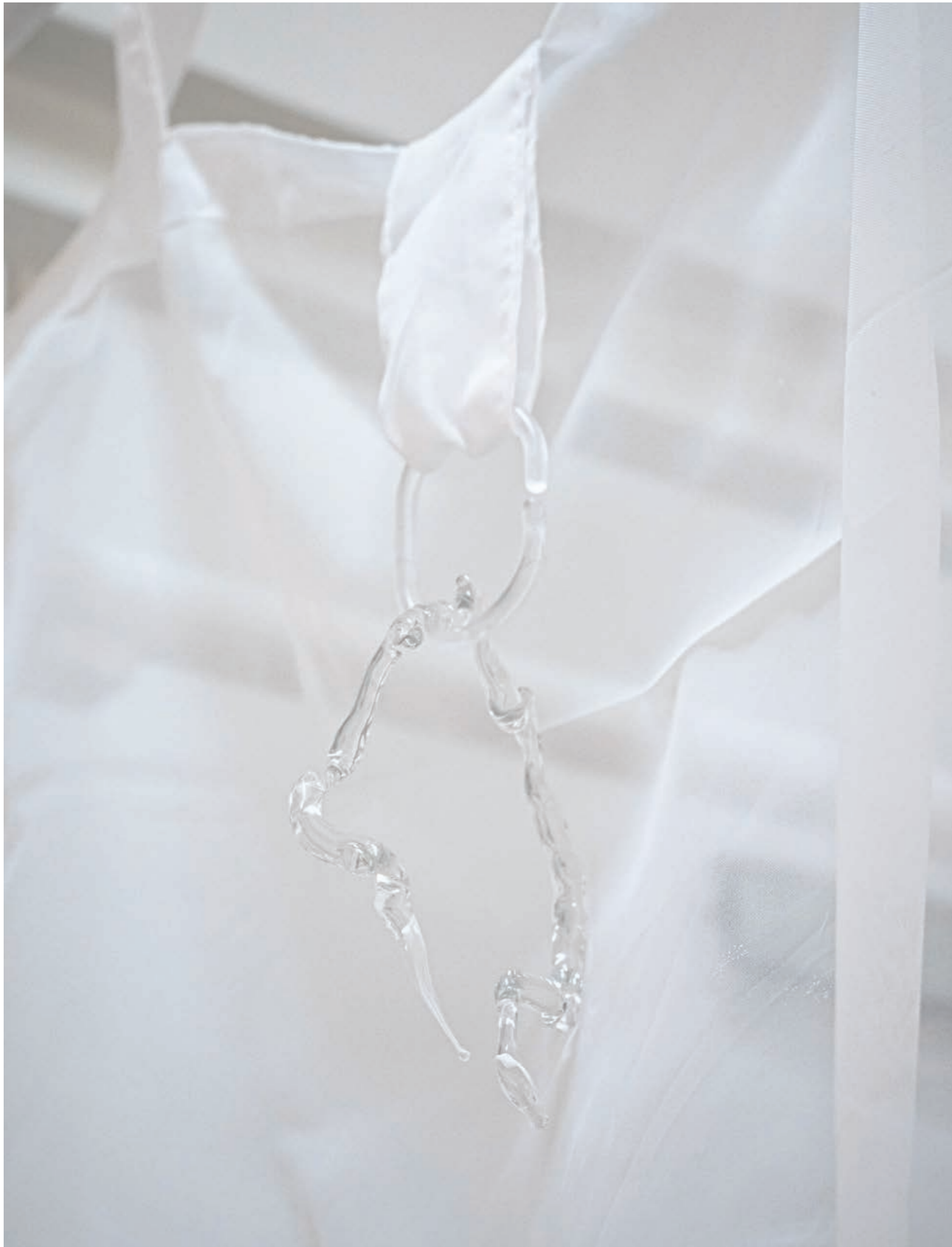
Jus de coquilles