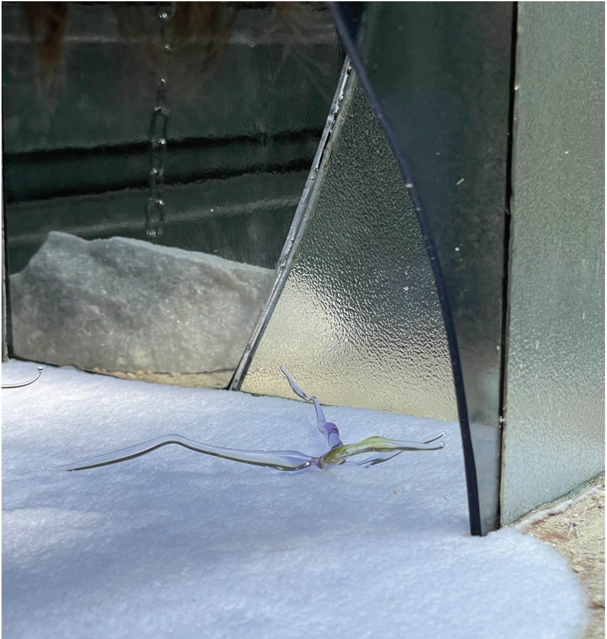
La maison au poil de Cristal