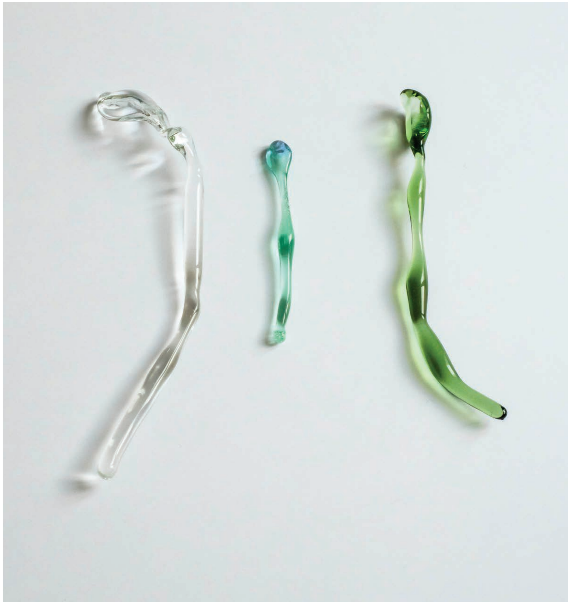
Fond de tiroir