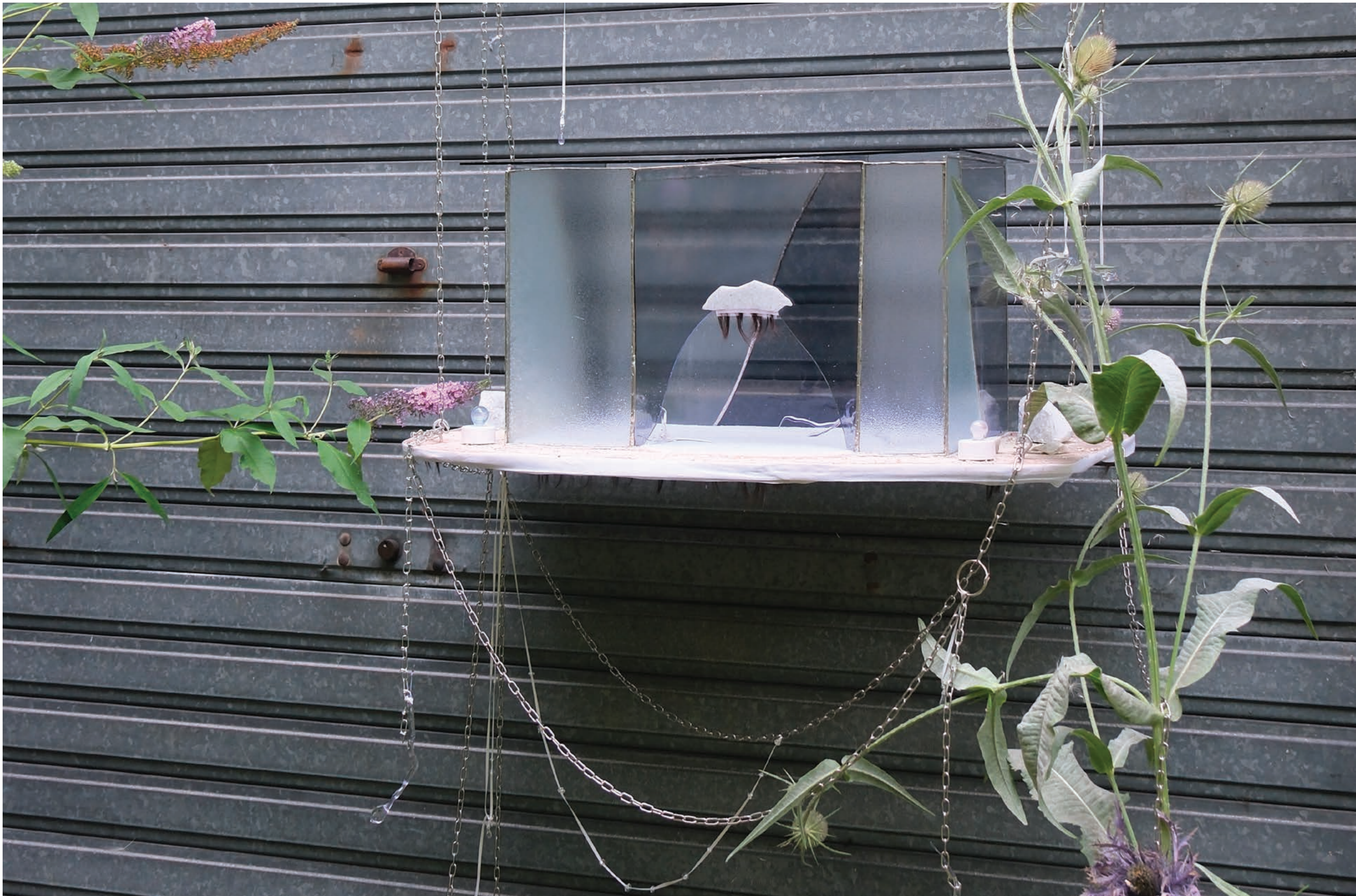
La maison au poil de Cristal