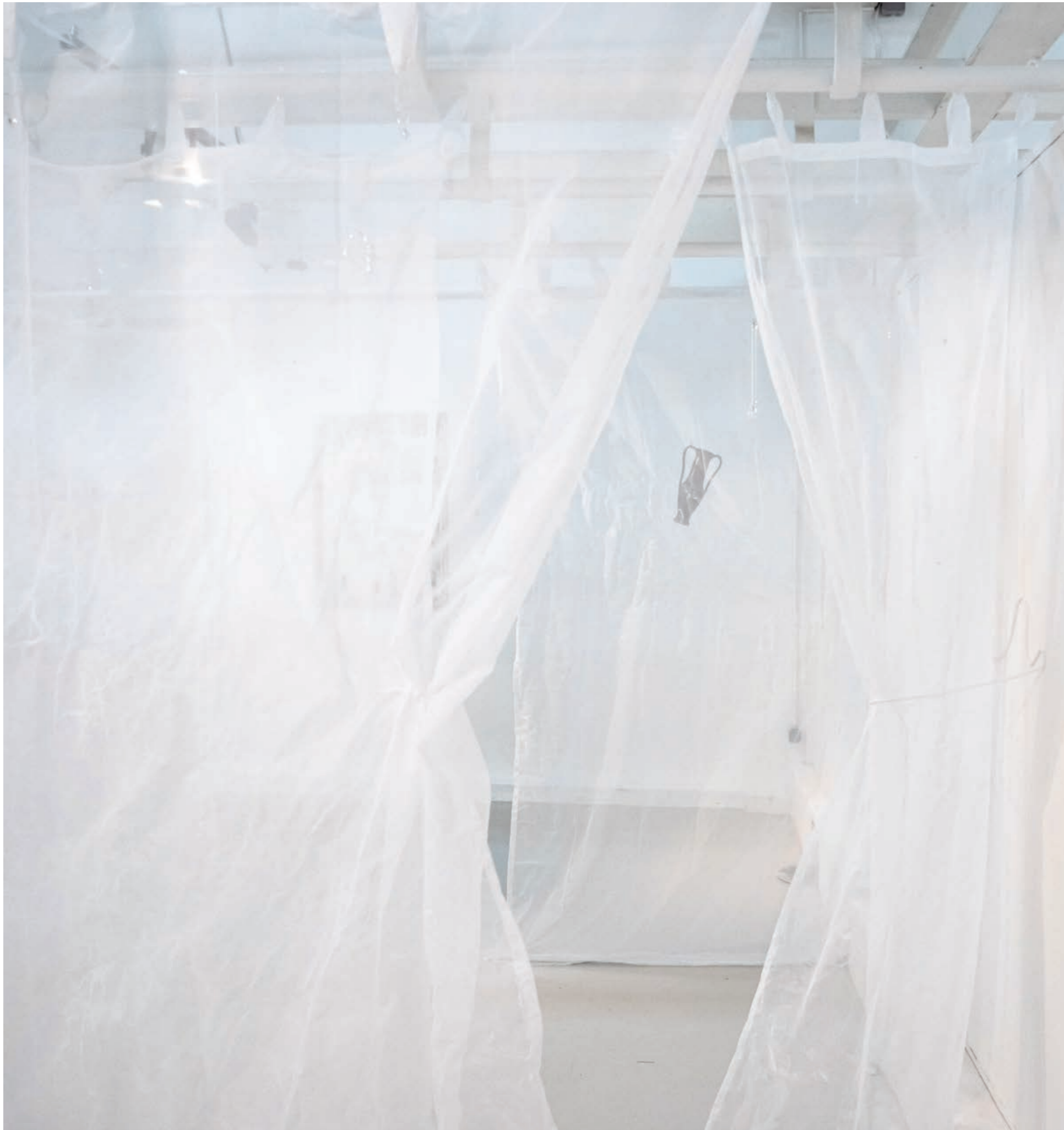
Jus de coquilles