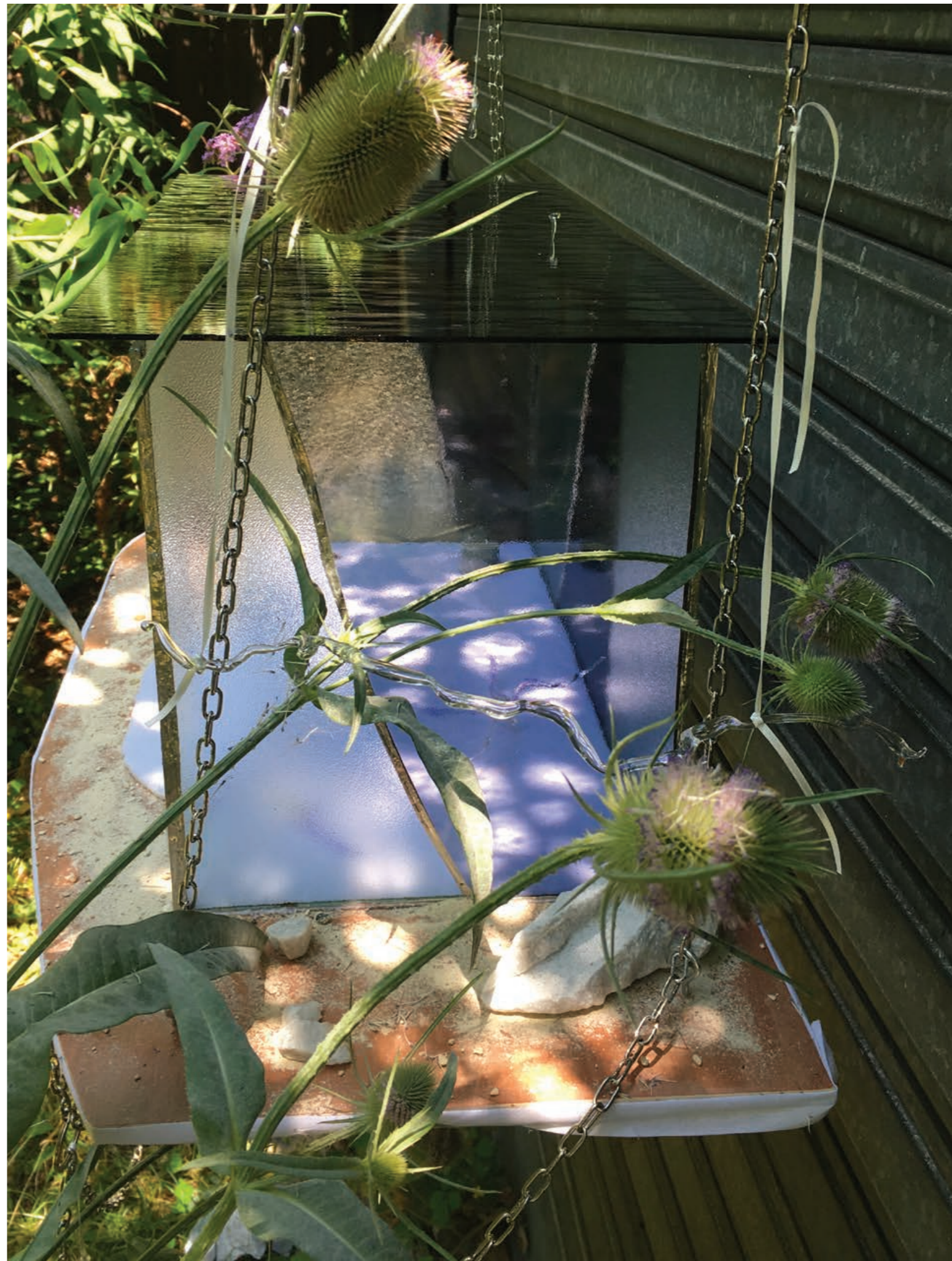
La maison au poil de Cristal