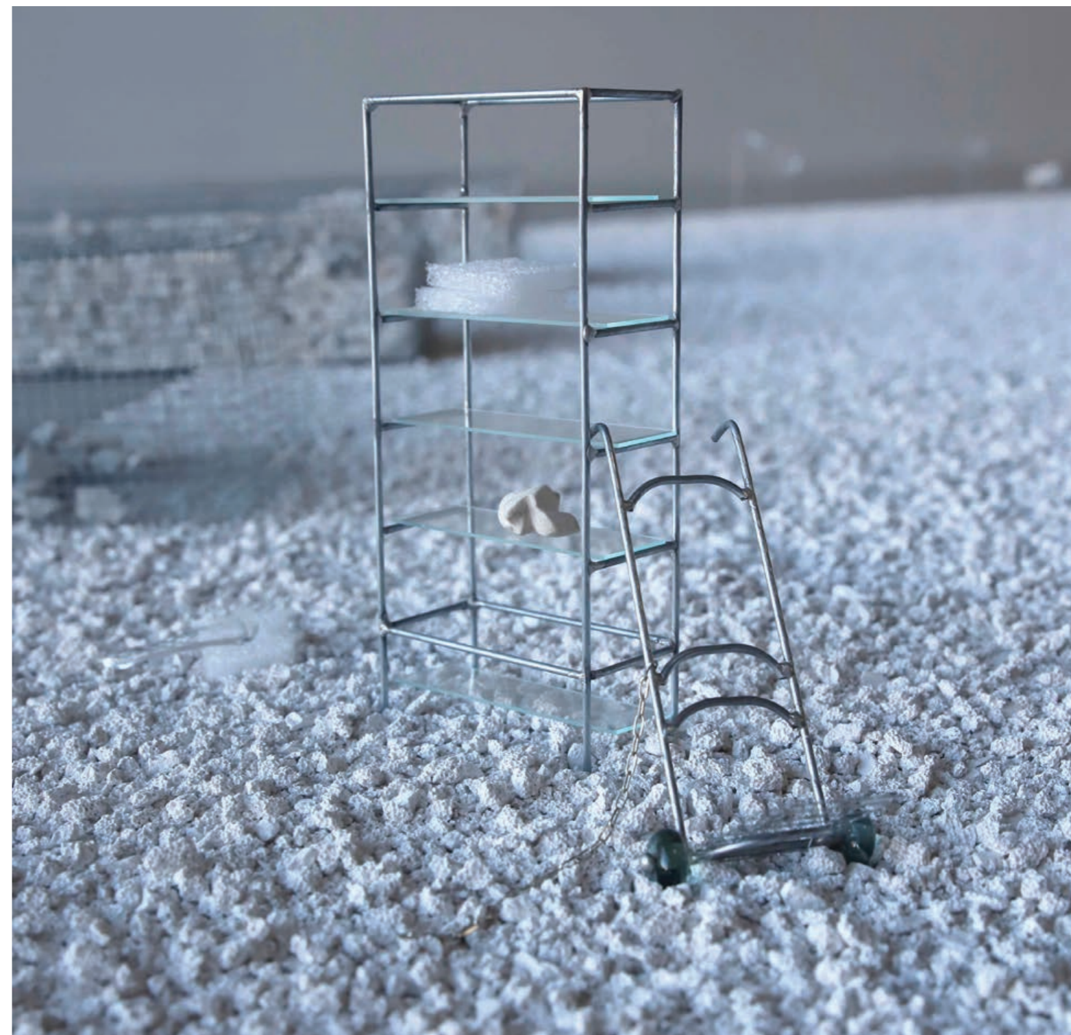
Diable a roulettes