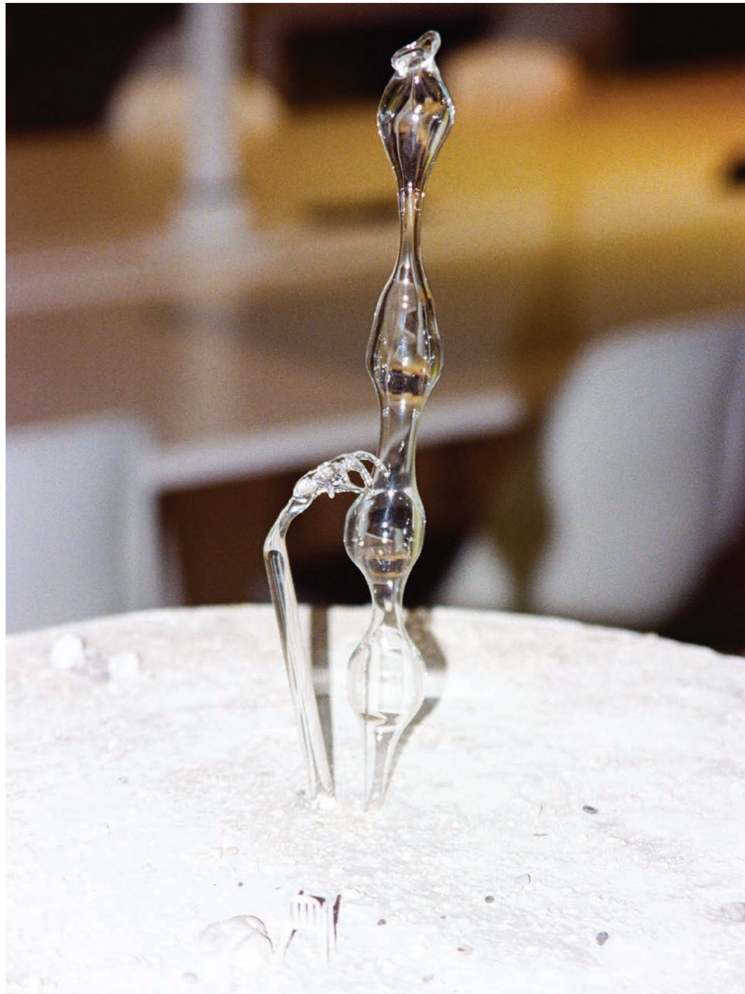
Maquette d'une sieste