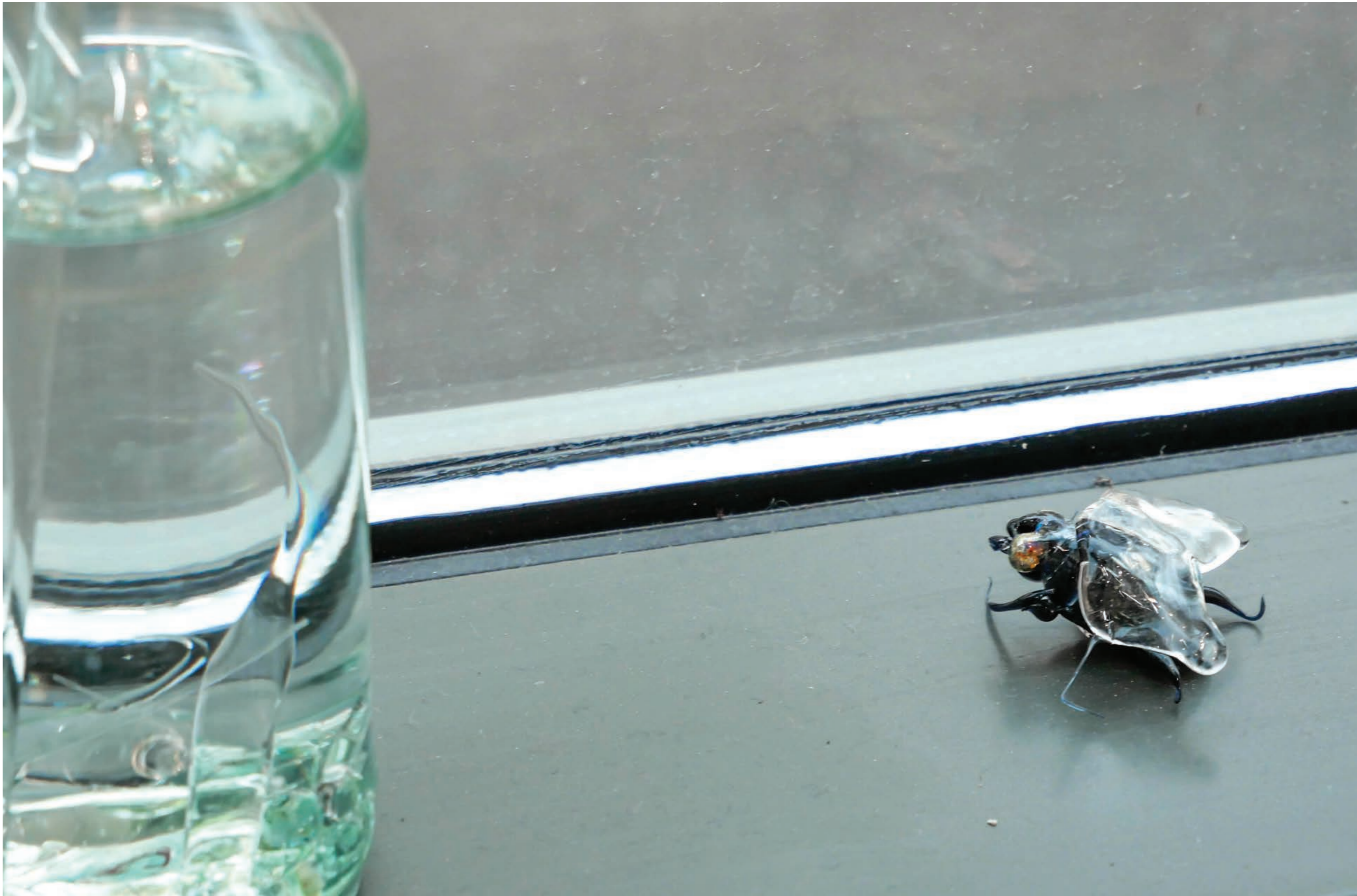
Une Mouche Volet

Verre filé au chalumeau (borosilicate), bouteille en verre, eau.