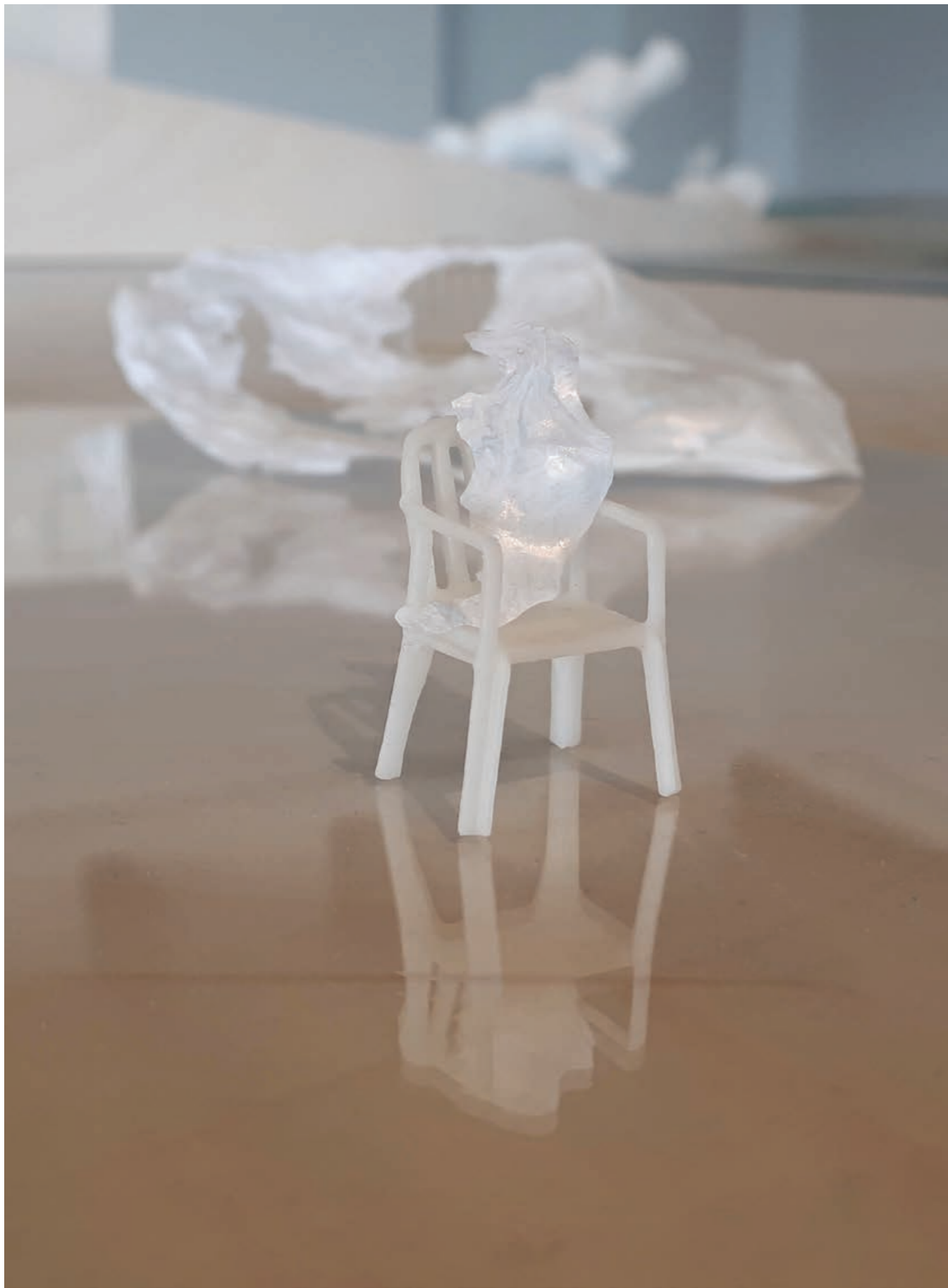
Chaises et coquillage

Dessin et impression 3d, plastique, nacre de coquillage, 1 x 2 x 1 cm, 2022