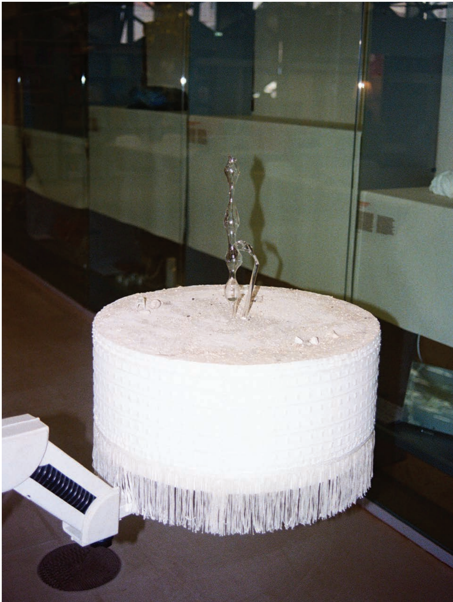
Maquette d'une sieste