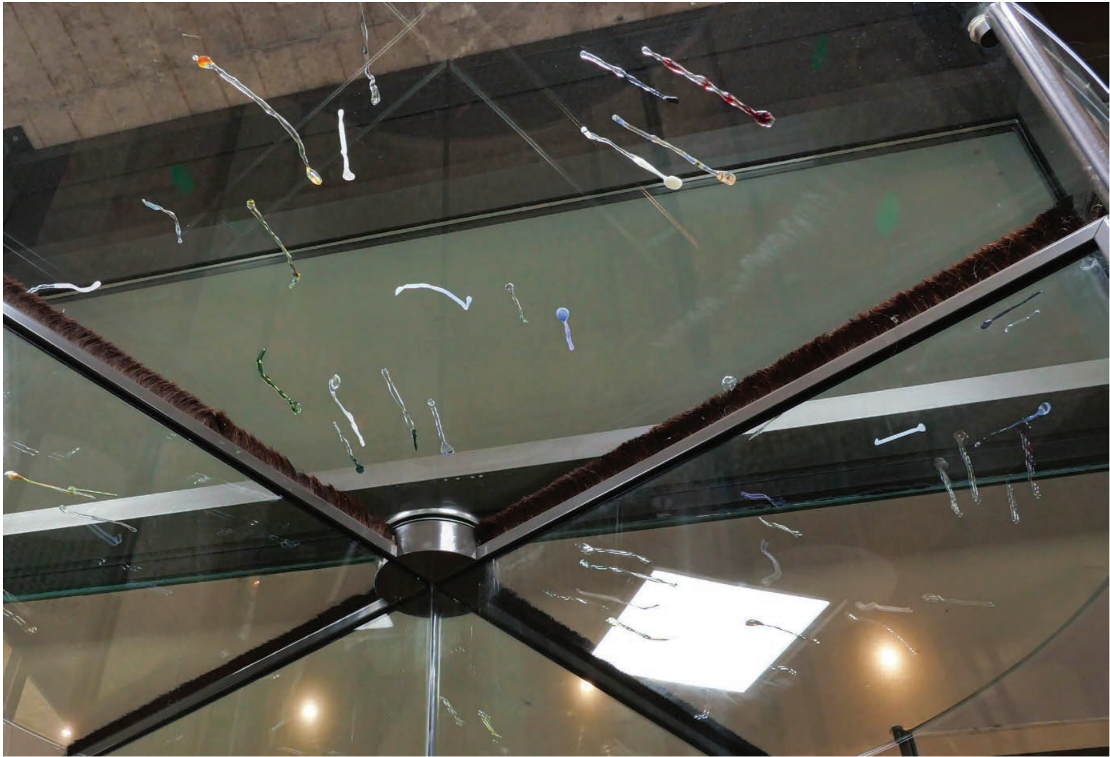
Fond de tiroir