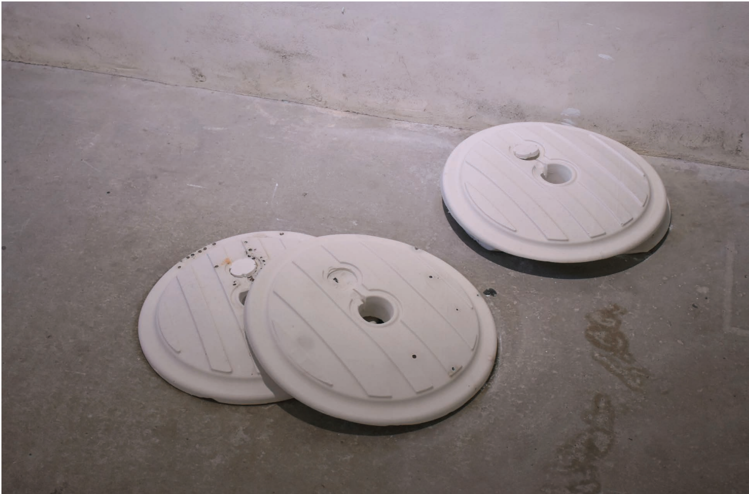
Pied de un trois

Plâtre et Smarties, env 60 x 60 cm, 2020