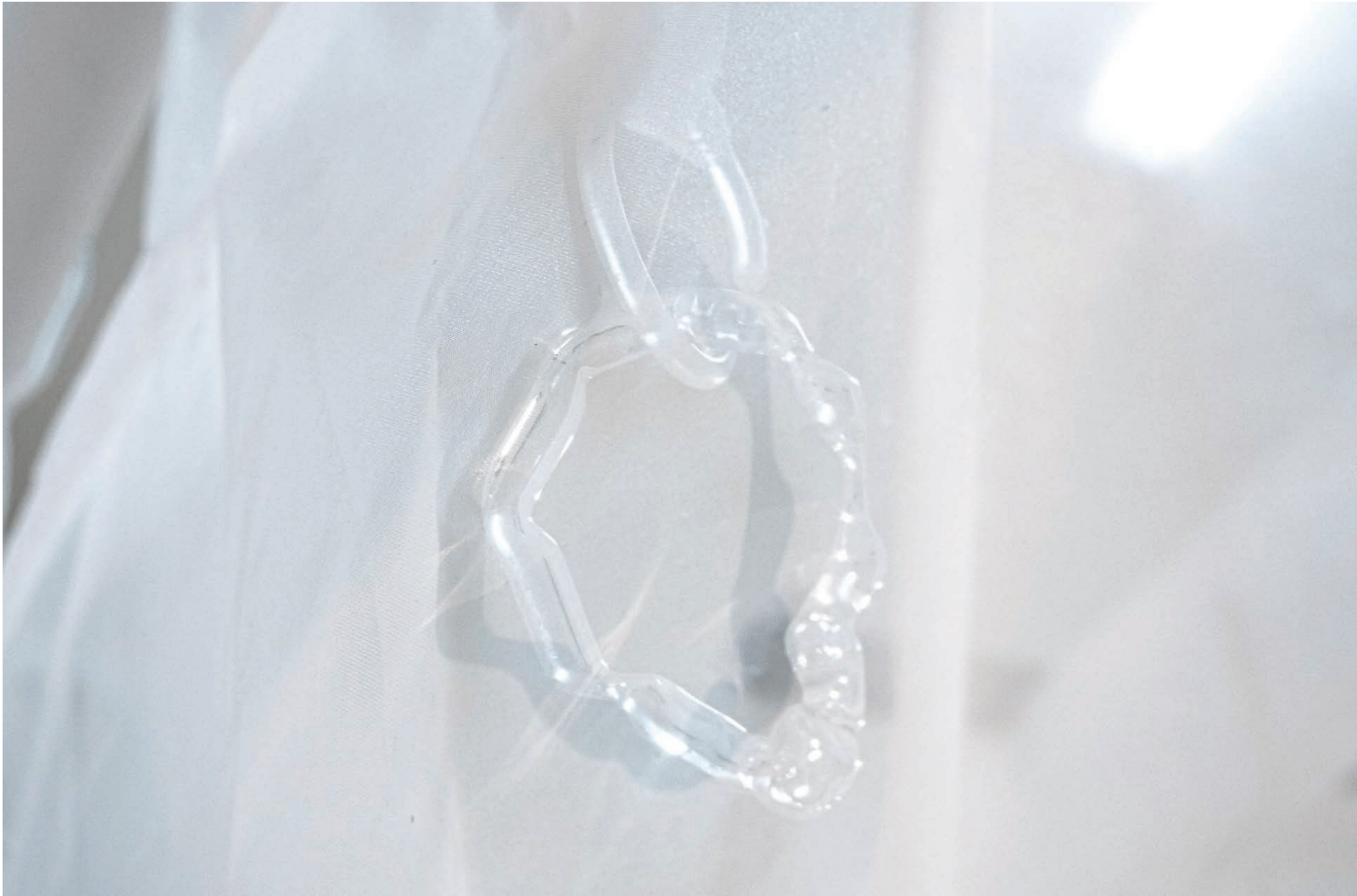
Jus de coquilles