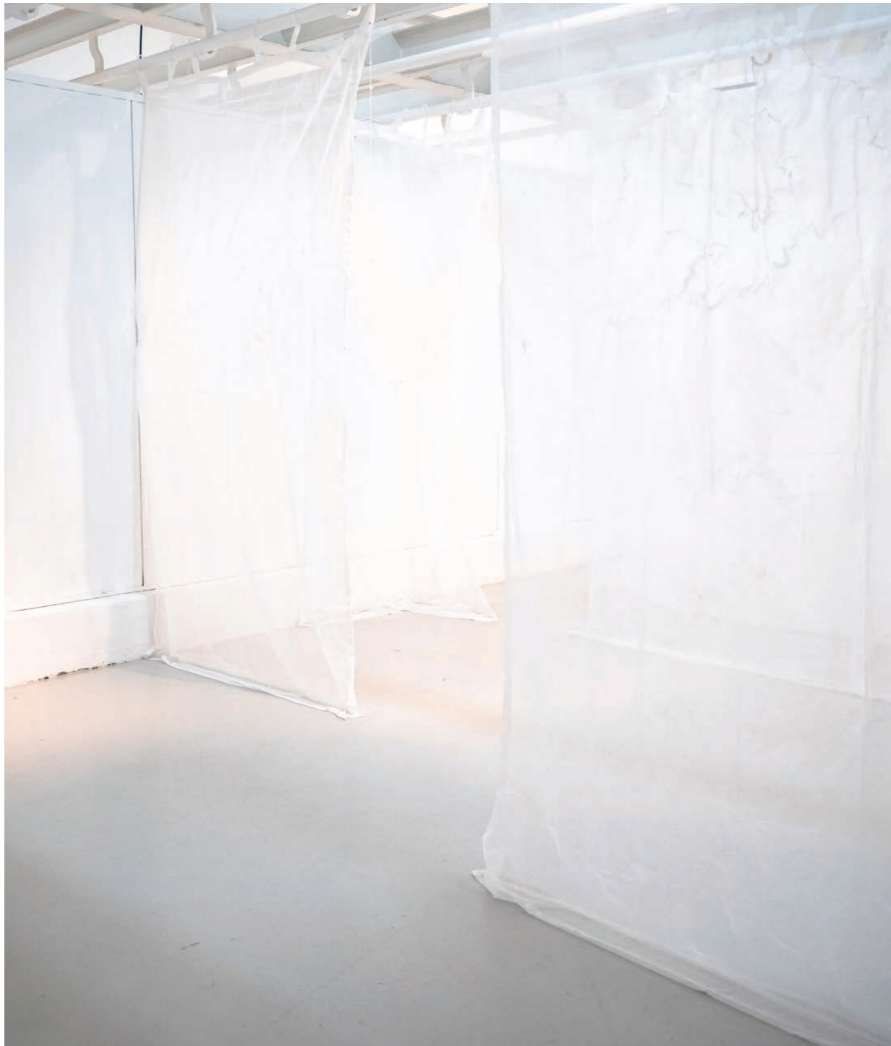
Jus de coquilles