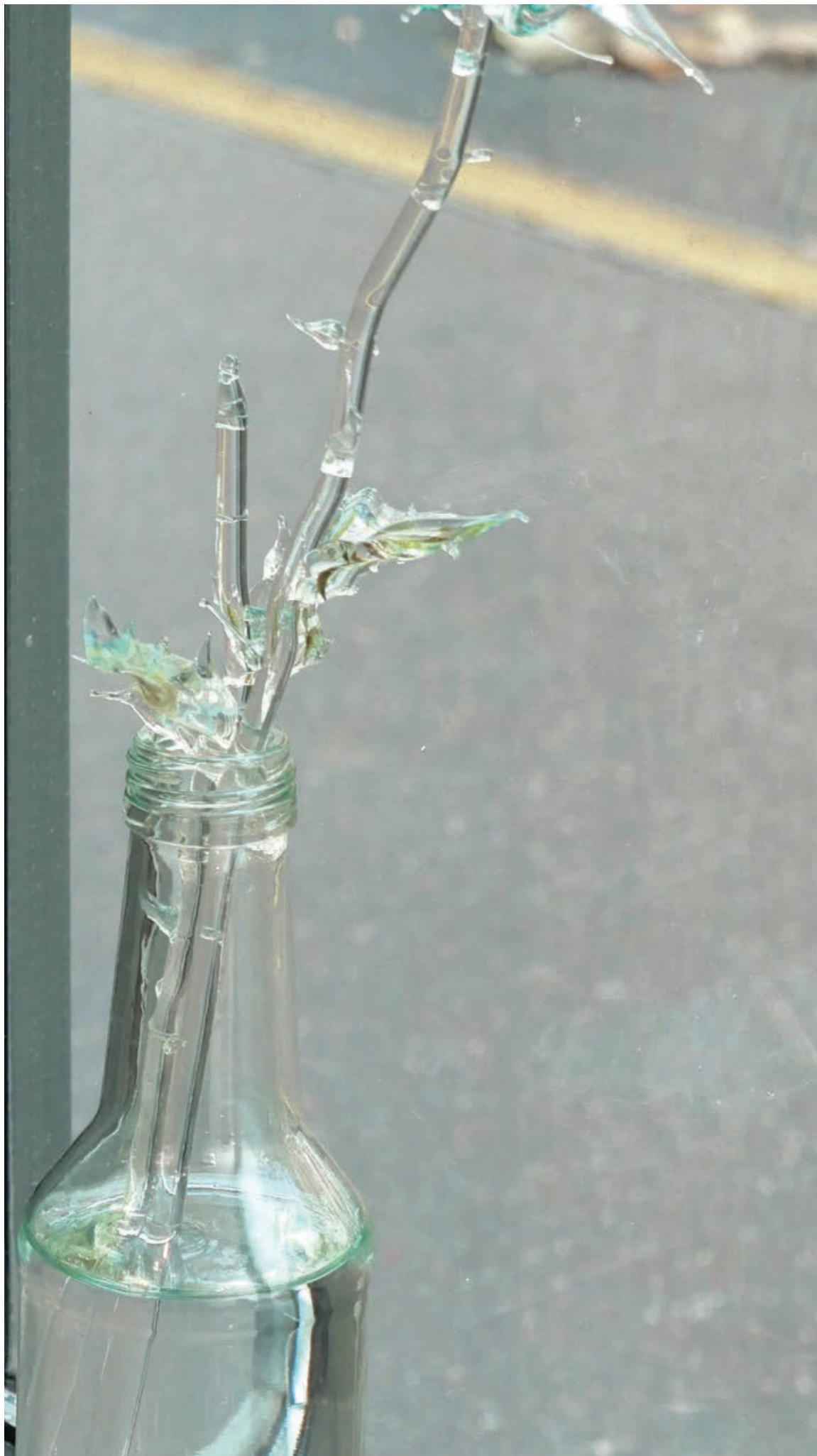
Une Mouche Volet