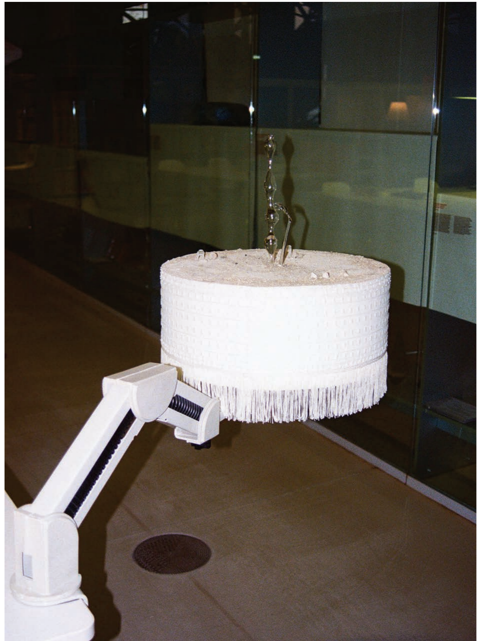
Maquette d'une sieste