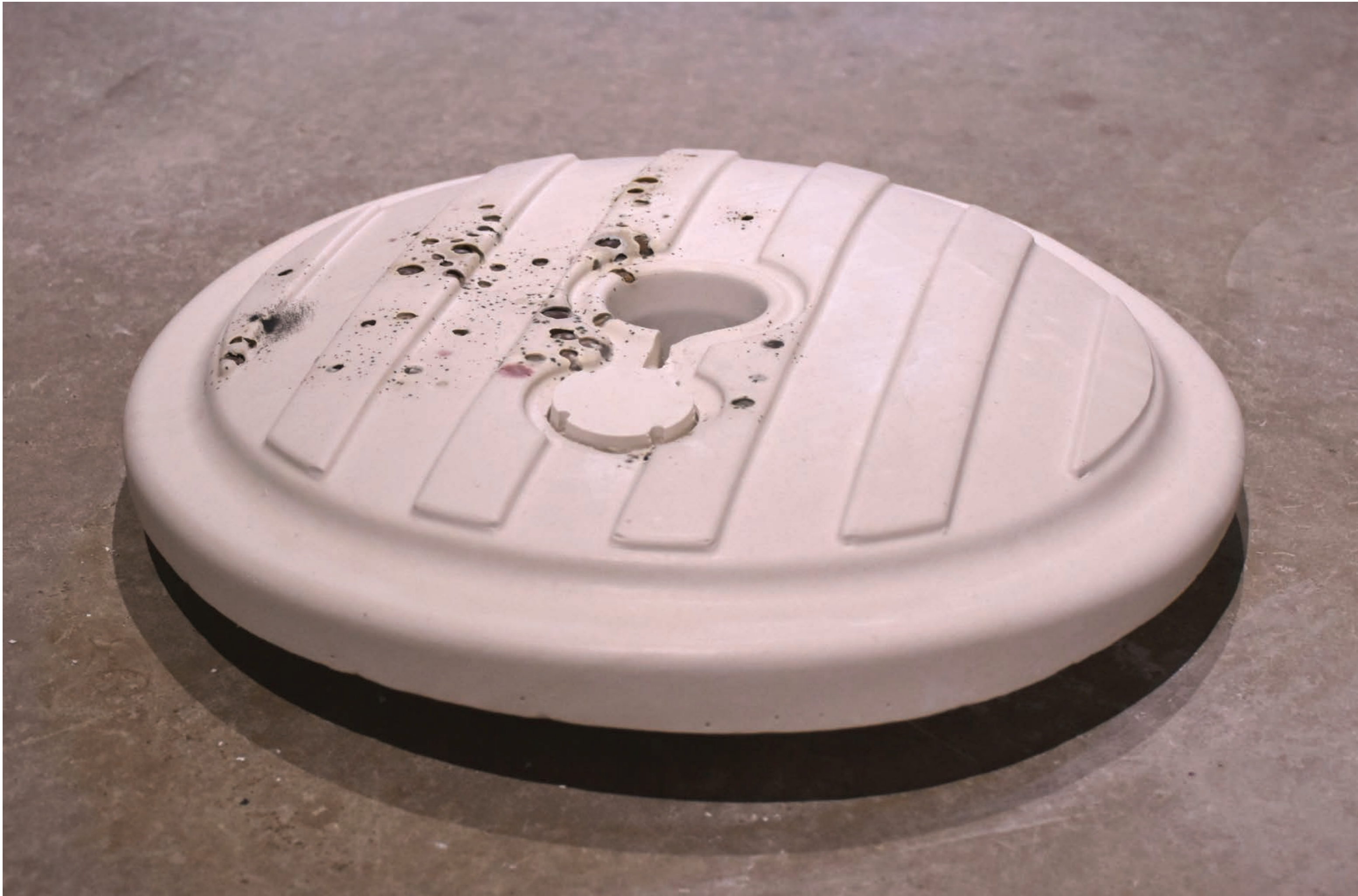
Pied de un trois

Plâtre et Smarties, env 60 x 60 cm, 2020