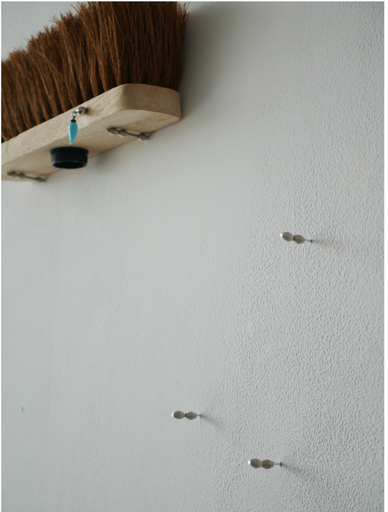
🏠 Sans titre, 2024, clous, perles en métal