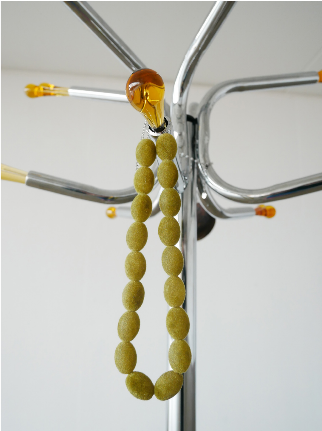
🕯 Sans titre, 2023, perles en velours, chaine