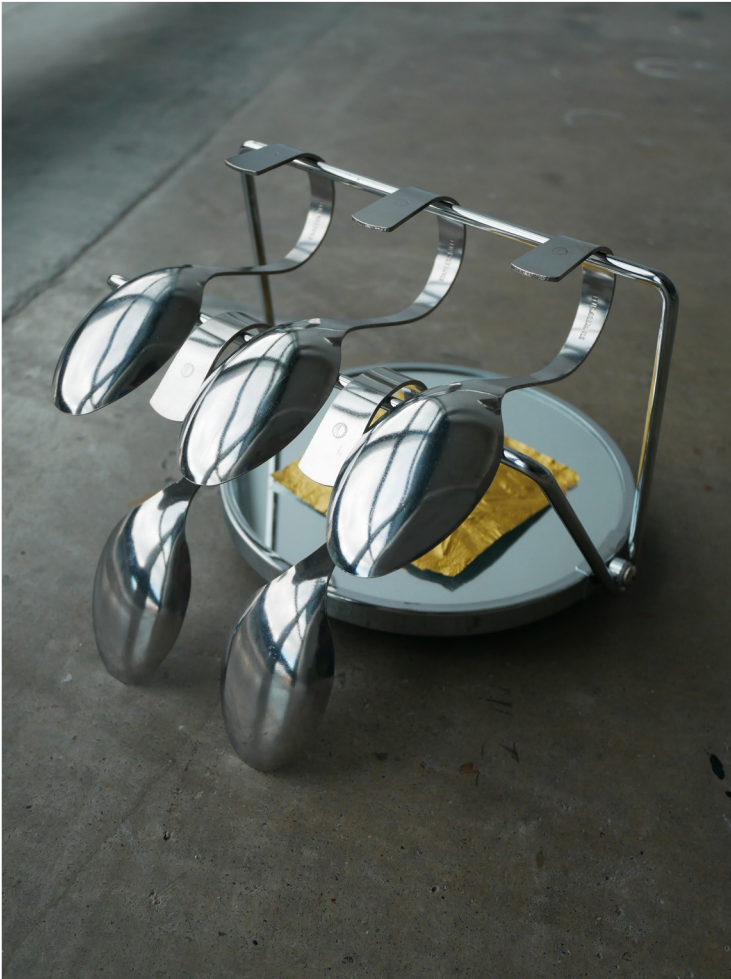
↳ Sans titre, 2024, miroir, papier de chocolat, cuillères, patins en feutre