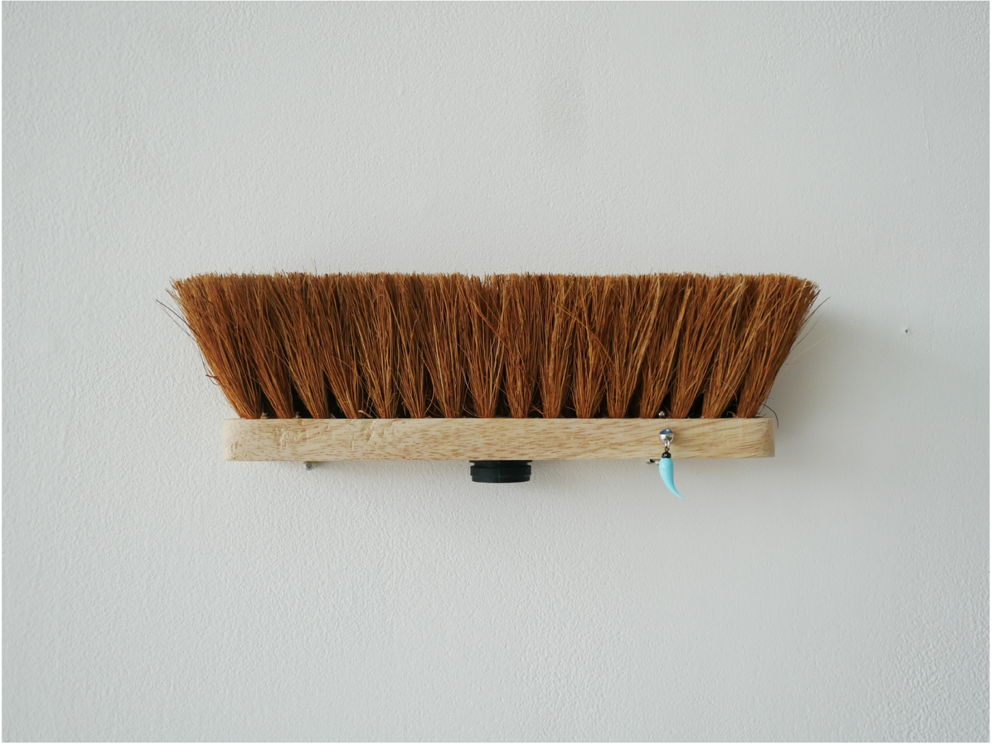
🏠 Sans titre, 2023, balai, piercing