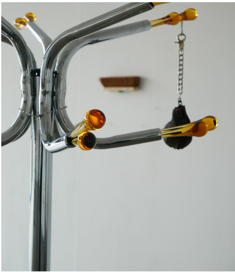
Sans titre, 2023, bracelet en perle, ♡ attaches de boucle d'oreille