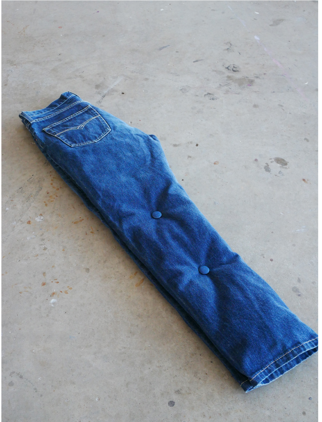
📍 Sans titre, 2024, jeans, boutons, ouate