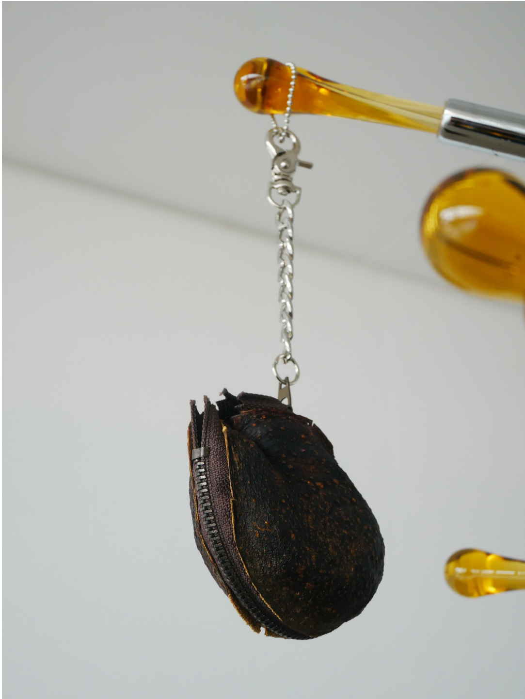
🔗 Sans titre, 2023, peau d'avocat, fermeture éclair, chaîne