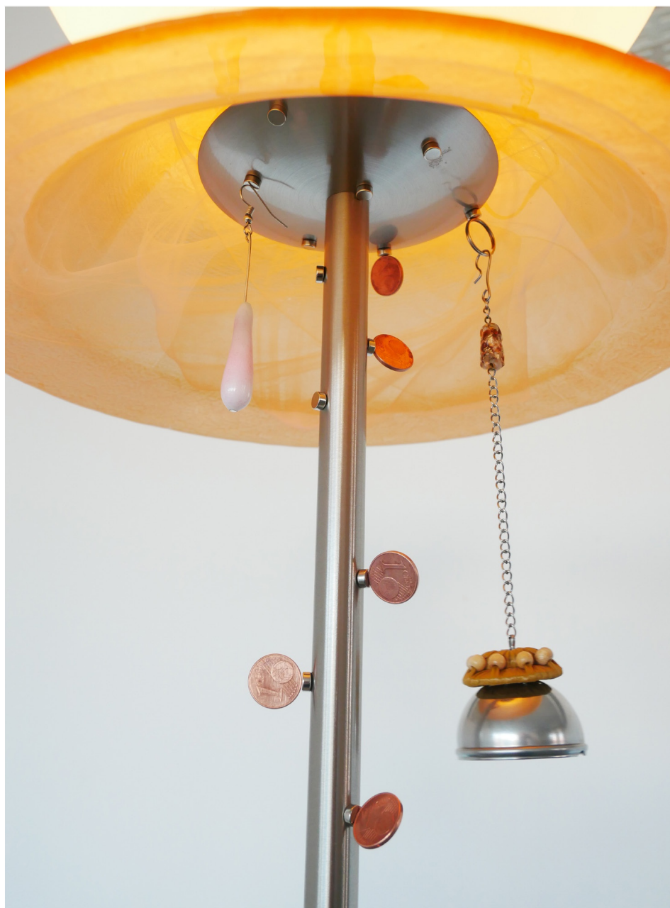
♫ Sans titre, 2023, boule à thé, bouton en raphia, perle en verre