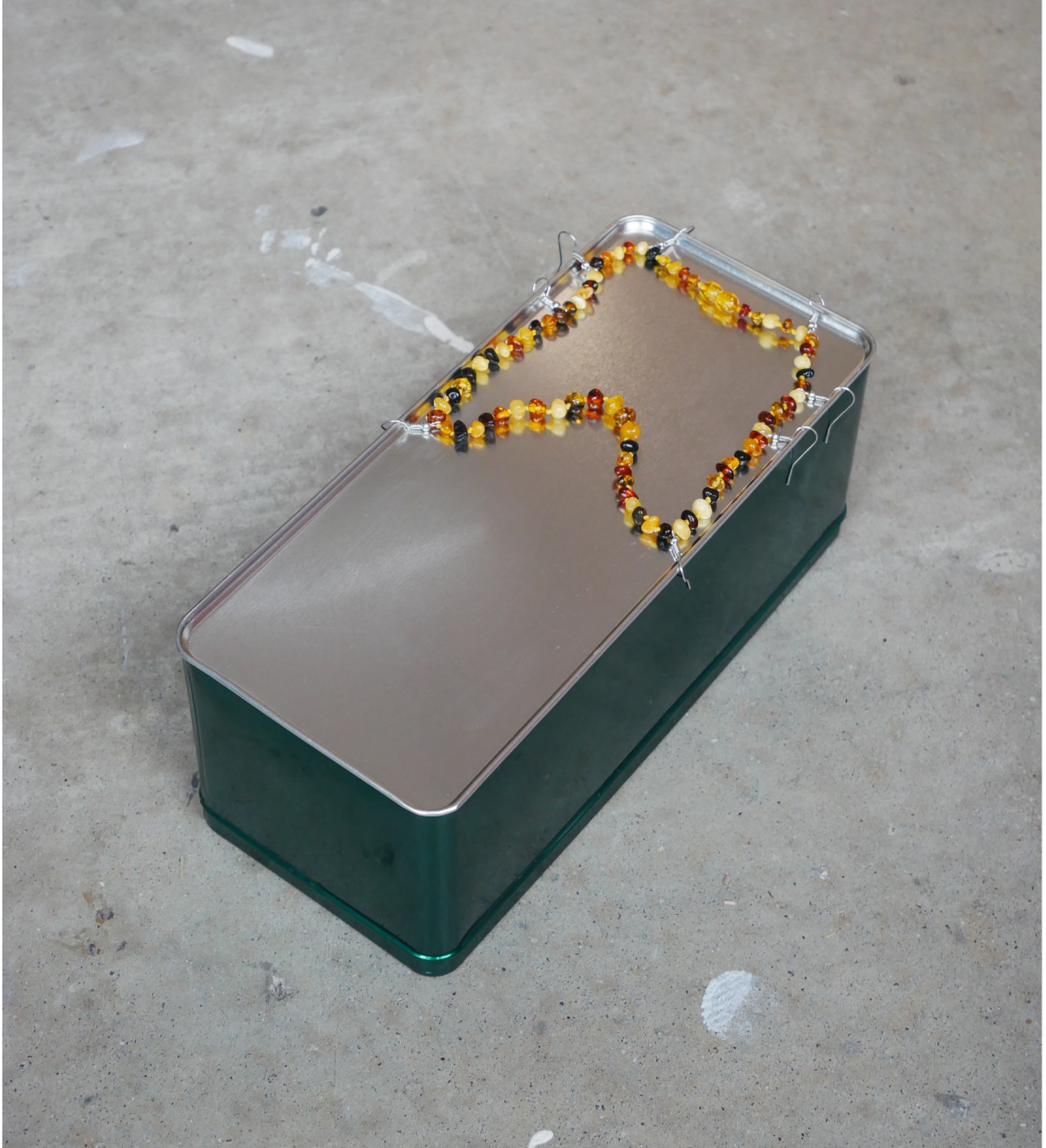
📍 Sans titre, 2024, boîte de biscuits, collier d'ambre, attaches de boucle d'oreille